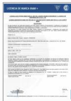
Certificado do System N° 5 recommended by Res. N° 19 de 25/Jun/1992 do MERCOSUL

A SNJ, atendendo as exigências do mercado, desde de 2.012, tem implantado e aprimorado ano a ano o seu Sistema e Gestão de Qualidade, ISO 9.001/2.008 atendendo todas as exigências ambientais vigentes e sociais. Em 2.016/2.017, a SNJ em consonância com a SADOKIN conseguiu atender às exigências das legislação Argentina, obtendo o certificado de Segurança Elétrica e iniciou a exportação de sinaleiros e Lâmpadas incandescentes à fabricantes de eletrodomésticos e conquistando o espaço no mercado Mercosul (Argentina).