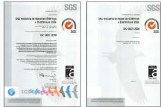
Certificado ISO 9001 para lâmpadas LED

A SNJ, atendendo as exigências do mercado, desde de 2.012, tem implantado e aprimorado ano a ano o seu Sistema e Gestão de Qualidade, ISO 9.001/2.008 atendendo todas as exigências ambientais vigentes e sociais. Em 2.016/2.017, a SNJ em consonância com a SADOKIN conseguiu atender às exigências das legislação Argentina, obtendo o certificado de Segurança Elétrica e iniciou a exportação de sinaleiros e Lâmpadas incandescentes à fabricantes de eletrodomésticos e conquistando o espaço no mercado Mercosul (Argentina).